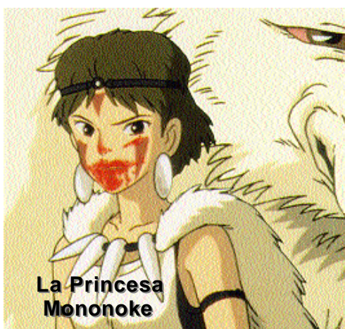
La Princesa Mononoke

Ofrecemos una relación de películas manga, el fenómeno de cine de animación que triunfó en España, en su país de origen (Japón), y en el resto del mundo